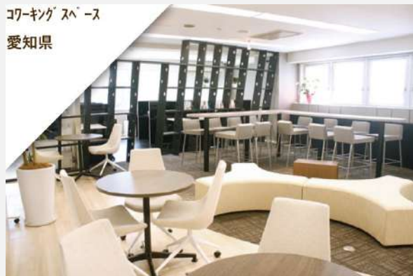
コワーキングスペース 愛知県