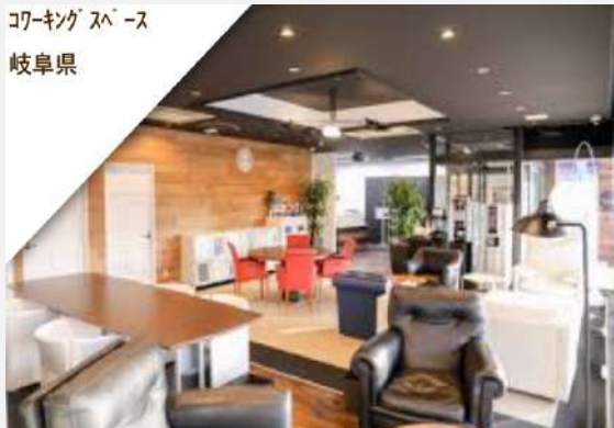
コワーキングスペース 岐阜県