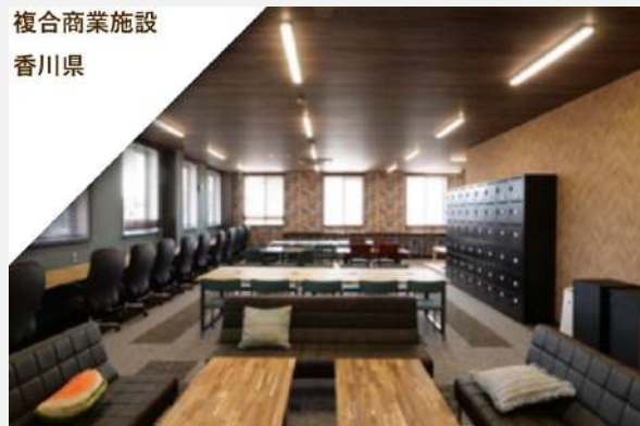
複合商業施設 香川県