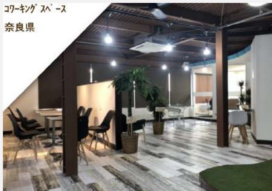
コワーキングスペース 奈良県