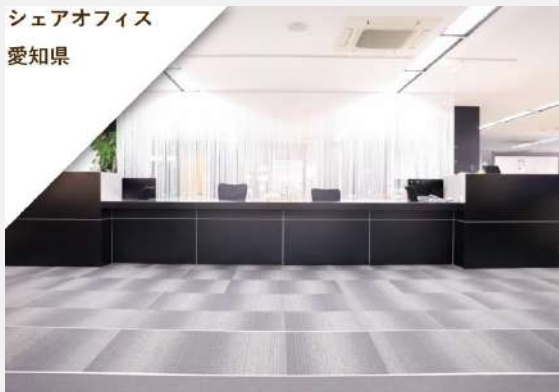
シェアオフィス 愛知県